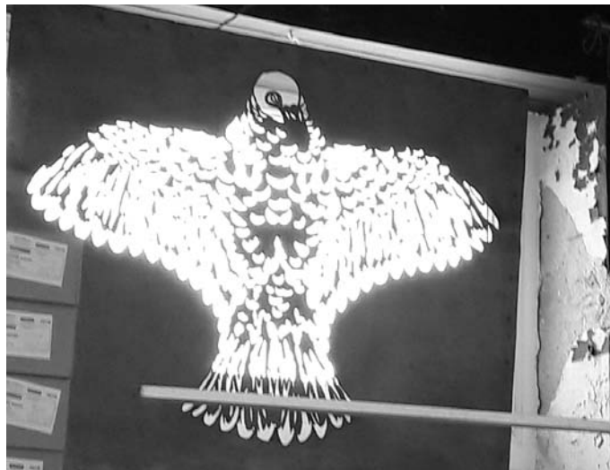
Pochoir de zinc "aigle"

- en 1990 Georges Deffain, son petit-fils découvre dans les greniers du Grand Bazar des malles contenant de vieux cerfs-volants : il décide de les restaurer et de les exposer dans le magasin.