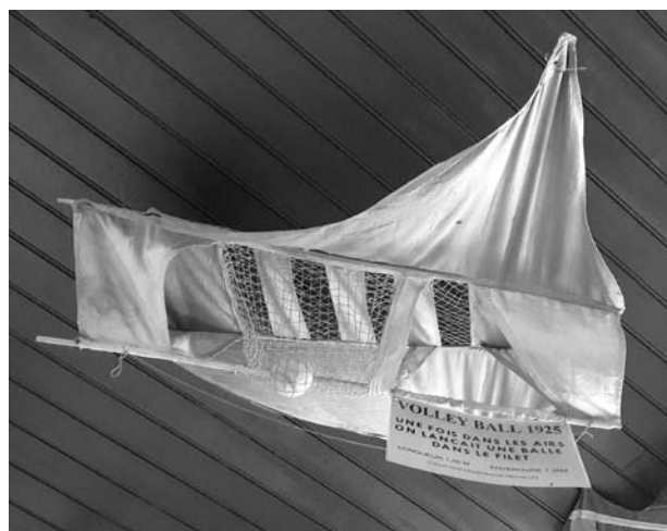
le Volley Ball, 1925

exhumé du grenier familial une collection unique en France, et quelle collection !