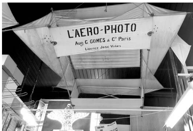
le célèbre Aéro-photo de Gomes

Il fallait lancer une balle dans le cerf-volant